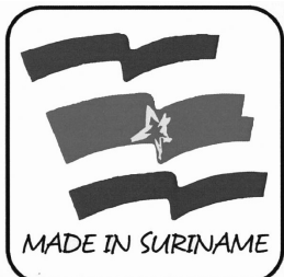
Ons keurmerk Made in Suriname

De ASFA ontwikkelde het keurmerk voor productiebedrijven die willen laten zien dat ze een bepaald niveau hebben bereikt. Het keurmerk wordt verstrikt aan producenten die hebben aangeleerd op een verantwoorde manier hun productie te hebben georganiseerd. De procedure ter verkrijging van het keurmerk is als volgt: aanvraag en beoordeling. Bij resultaat 'ready' wordt het ASFA keurmerk 'Made in Suriname' uitgereikt. Is het resultaat 'not ready' dan wordt men verwezen naar een consultant om klaargestoomd te worden voor het verkrijgen van het keurmerk.