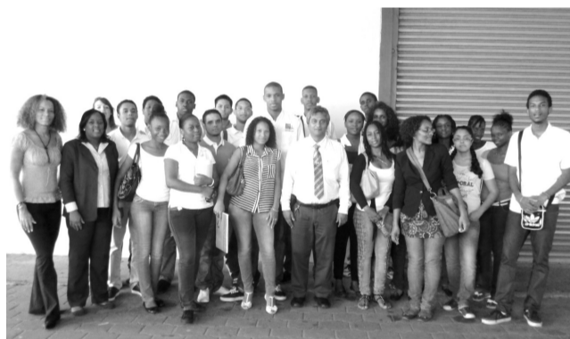
Studenten van EGC French Guiana op bezoek bij KKF

23 studenten en 2 begeleiders van EGC French Guiana brachten maandag 3 juni j.l. een bezoek aan de KKF. EGC French Guiana verzorgt een 3-jarig studieprogramma dat studenten opleidt tot: bedrijfsleiders die de uitdagingen aankunnen m.b.t. marketing, verkoop, administratie, finance, human resources, computer systemen en internationaal recht. Het bezoek aan Suriname beoogde de studenten bekend te maken met de cultuur en professionele aanpak van zaken in Suriname. Er zijn