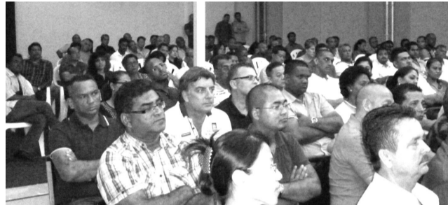
Enorme belangstelling voor de issues in kwestie

De conceptbrief over de 'Pre-shipment Inpectie (PSI)' betreft een verzoek tot uitstel hiervan. Aangegeven wordt dat er adequate overlegstructuren zijn zoals het Suriname Business Forum (SBF) waarin de kwestie aan de orde kon worden gesteld. Aan de bewindsvrouw wordt aanbevolen van dit forum gebruik te maken. Gevraagd wordt de ingangsdatum van PSI tot nader order uit te stellen tot er duidelijkheid is over te volgen procedures door het bedrijfsleven en de overgang naar de nieuwe situatie soepel kan verlopen. Voorgesteld wordt de PSI (fysieke controle) in het buitenland te laten vervallen vanwege de hoge kosten en in Suriname de controle te laten uitvoeren door SGS (Société Générale de