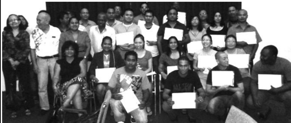
De geslaagde cursisten van de laatstgehouden Opleiding tot Douane Expediteur tonen met trots het behaalde certificaat

De Opleiding tot Douane Expediteur werd van 4 april 2011 t/m 17 oktober 2012 gehouden. 35 cursisten hebben deze opleiding met goed gevolg doorlopen. Het vakkenpakket bestond uit: Tarief, Waardeleer, In-Uit- en doorvoer, Accijnzen en Overige wetgeving, Vrijstellingen, Elementair recht, Schriftelijke Vaardigheden en Engels. Doel is mensen te certificeren hetgeen internationaal vereist is om de ingevoerde goederen vrij te maken naar de importeurs toe. De certificaatuitreiking vond plaats op donderdag 19 december j.l. in de conferentiezaal van de KKF.