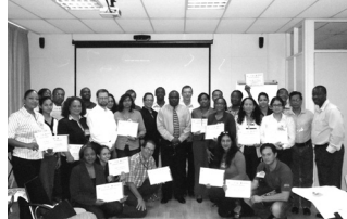
Trainees met hun certificaten tezamen met de trainers

De certificaatuitreiking van de Specialty Foods Export Training vond plaats op donderdag 24 maart j.l. in de conferentiezaal van het Ministerie van Handel en Industrie. De training bestond uit twee componenten: * studie van de specialty food sector in de Cariforum; * promotie van Cariforum Specialty Food Products met het oog op deelneming aan de Specialty Foods Shows in de USA en Europa. Deze training is mogelijk gemaakt door een samenwerking van