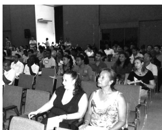
Een deel van de aanwezigen op de Teach-In van de Jaarbeurs 2010

De Teach-In van de Jaarbeurs 2010 werd gehouden op 20 oktober j.l. Op deze bijeenkomst werd aan participanten van de beurs de beursrichtlijnen en instructies voorgehouden. Degenen die deze bijeenkomst hebben gemist kunnen alsnog contact maken met het beurssecretariaat voor het ophalen van het beursinstructieboekje en bestelformulieren voor badges en bijkomende voorzieningen daar er deadlines aan verbonden zijn. De beursorganisatie wenst alle deelnemers aan de beurs veel succes toe met de voorbereidingen.