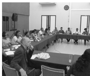
Een deel van de 21 Franse studenten van de Guyanemanaged Business School EGC.

In verband met de samenwerkingsovereenkomst tussen de KKF en de Franse Kamer van Koophandel (CCIG), bracht een groep Franse studenten op woensdag 01 juni j.l. een bezoek aan de KKF. Deze studenten zijn afkomstig van de Guyanemanaged Business School EGC. Ze waren in Suriname voor een periode van 7 dagen om internationale ervaring op te doen. Na een presentatie door de KKF en het Suriname Business Forum, kregen ze een rondleiding van het kantoor. De studenten brachten verder bezoeken aan ver-