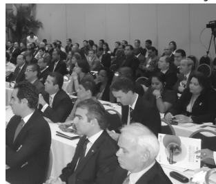
Conferentie Business Opportunites

Trinidad, Dominicaanse Republiek en Spanje. Er zijn presentaties gehouden over handelsmogelijkheden binnen de CARIFORUM en de EU die te zijn zynen tijd op de website van de KKF zal worden gepubliceerd. Er zijn verder bezoeken gebracht en gesprekken gevoerd met de Kamer van Koophandel aldaar, de Agribusiness associatie, de AIRD (industriële organisatie), ADOZONA (associatie van free trade zones), de free trade zone council en de Caucedo Haven. Middels deze bedanken wij allen die hebben bijgedragen aan het welvagen van deze missie.