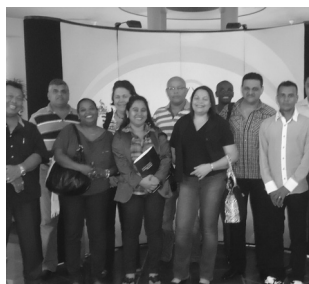
Een deel van de delegatie

De KKF heeft een succesvolle oriëntatie missie uitgevoerd naar de hoofdstad van de Dominicaanse Republiek, Santo Domingo, in de periode 28 mei t/m 1 juni jl. Aan de missie hebben 14 bedrijven en organisaties deelgenomen met een totaal van 17 personen. Deze missie was meer gericht op oriëntatie en marktinformatie. Tevens heeft de groep ook deelgenomen aan een Business Forum waarin landen hebben geparticipeerd als Suriname, Antigua, Jamaica,